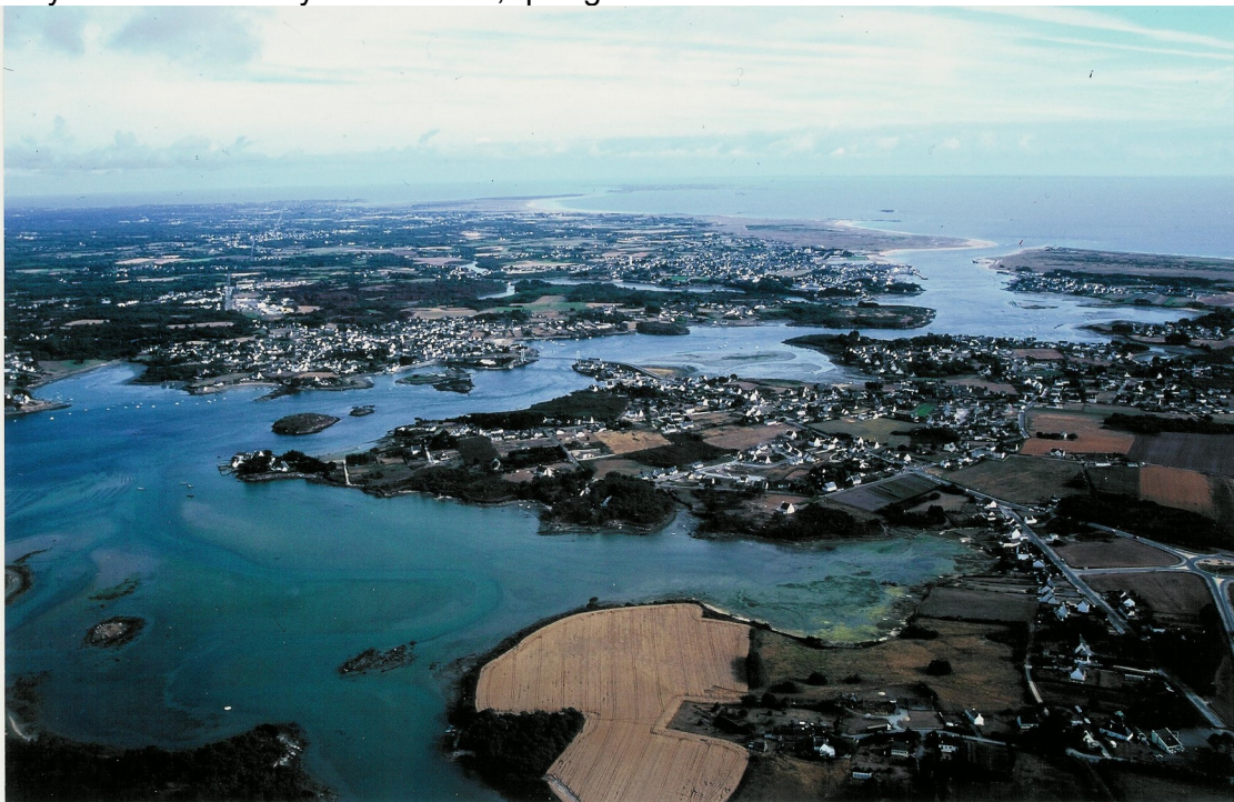
photo aérienne de l'urbanisation de la rivière d'Étel